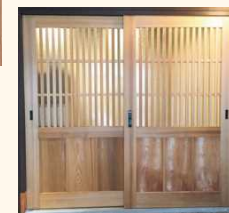
■杉の建具材を使用した玄関引き戸

物件ごとに異なる仕様に合わせたオリジナル造作材の製作を1本から承ります。また、巾木、見切、廻り縁といったモルディングから建具、家具の材料、階段板等も幅広く承ります。