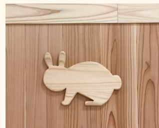
■NC加工で製造した遊び心のある無垢の造作