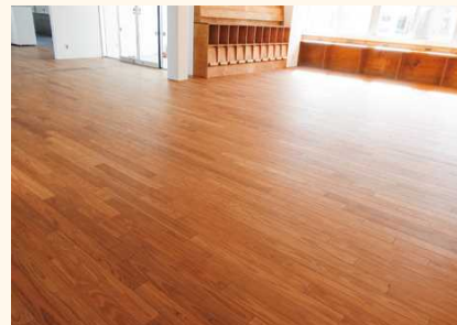
■表面のUV塗装はツヤあり・ツヤなしから選択可

傷つきにくさ、メンテナンスのしやすさ等から、市庁舎、教育機関等の公共施設で幅広くご使用いただいています。