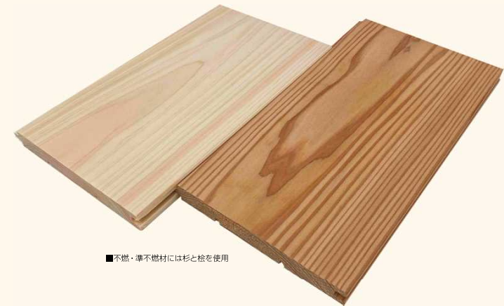
■不燃・準不燃材には杉と松を使用