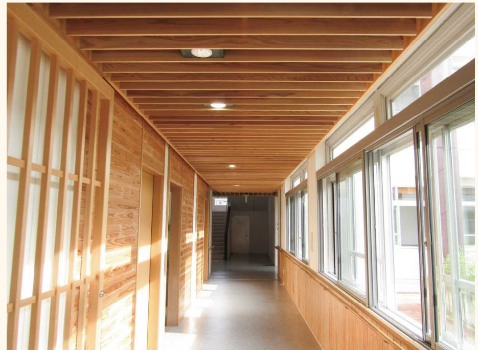
■巾木や窓枠他、全ての造作に杉の無垢材を使用した庁舎