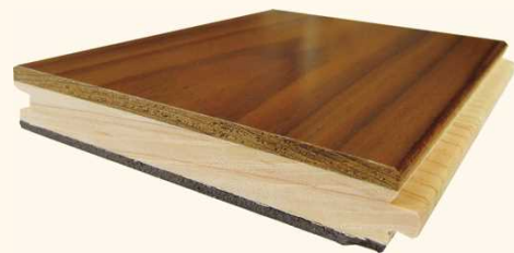
■杉の圧縮硬化単板、無垢材や合板の台板、クッション材の複合フローリング